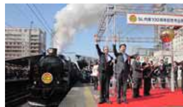
2012年2月SL出発式の様子(千葉みなと駅)

くす玉開花、花束贈呈、1日駅長になった地元の子供たちによる出発合図等を予定しています。