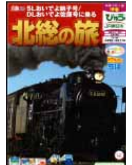
パンフレットイメージ

1泊2日4コース、日帰り2コースをご用意しました。 是非、SLやDLとあわせて北総の旅をお楽しみください!