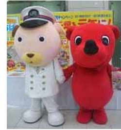
駅長犬(左)とチーバくん(右) (イメージ)