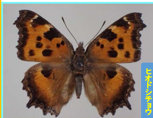
ゴオアミンキムシ