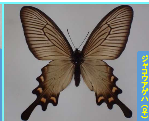
シキリウミアゲハ (♀)